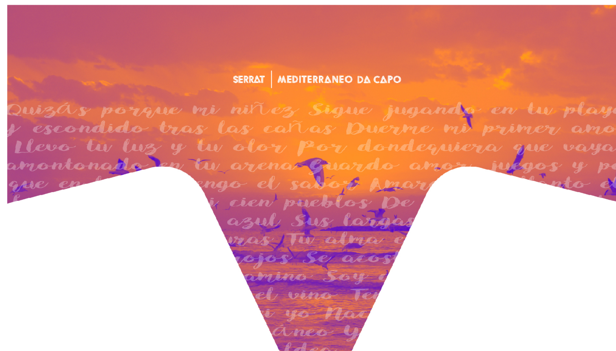
fig.02 / Imagen distorsionada proyectada sobre lona de escenario

Simulación del tratamiento de distorsión geométrica de la imagen para contrarrestar la distorsión natural de la proyección.