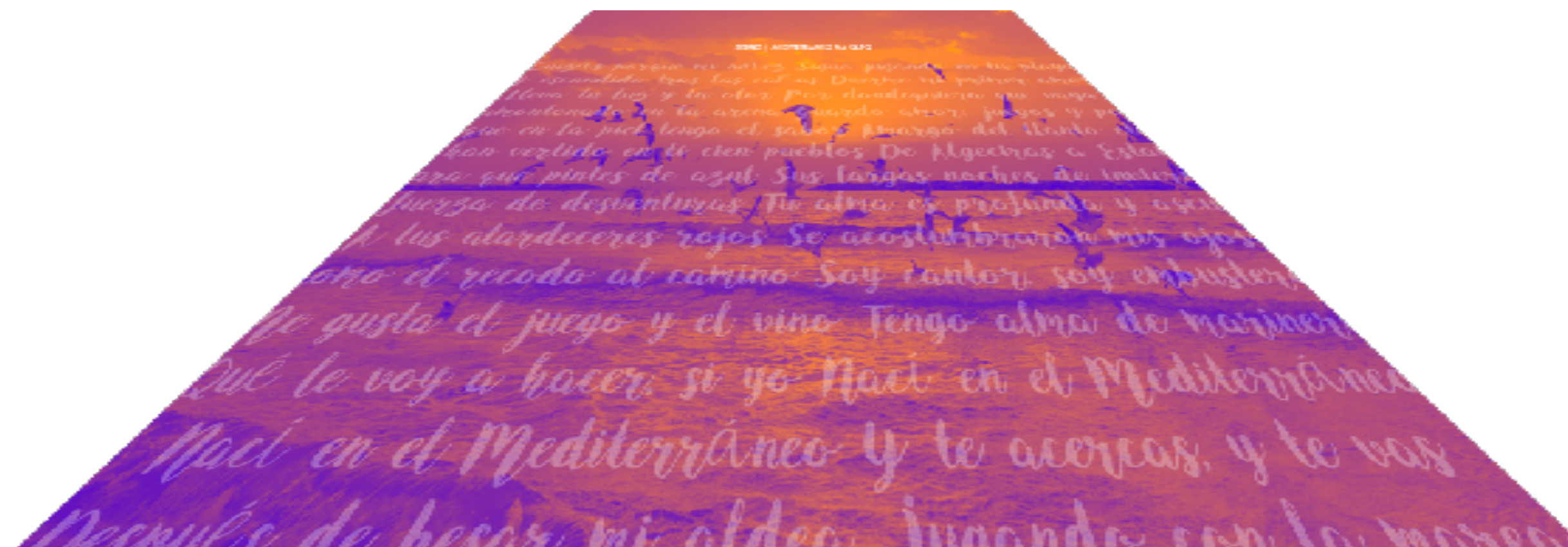
fig.01 / Imagen distorsionada para proyección

Simulación del tratamiento de distorsión geométrica de la imagen para contrarrestar la distorsión natural de la proyección.